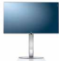
Center Floor Stand

Aufstellung: Chrom 55": B 132,6/H 130,2/TP 6,0/TG 60,4 46": B 113,3/H 118,8/TP 6,0/TG 52,4 40": B 100,0/H 111,3/TP 6,0/TG 52,4