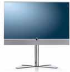
Floor Stand + Stereospeaker

Aufstellung: Chrom 55": B 132,5/H 130,2/TP 6,0/TG 60,4 46": B 113,3/H 118,8/TP 6,0/TG 52,4 40": B 100,0/H 111,3/TP 6,0/TG 52,4