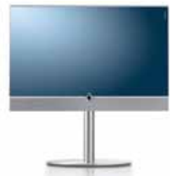
Floor Stand 8³ + Stereospeaker

Aufstellung: Alu Gebürstet 46": B 113,3/H 119,5/TP 6,0/FP 56,0 40": B 100,0/H 112,0/TP 6,0/FP 50,0