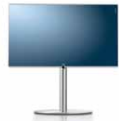
Floor Stand 8³

Aufstellung: Chrom 55": B 132,6/H 130,2/TP 6,0/TP 60,4 46": B 113,3/H 118,8/TP 6,0/TG 52,4 40": B 100,0/H 111,3/TP 6,0/TG 52,4 32": B 80,0/H 101,1/TP 6,1/TG 42,8