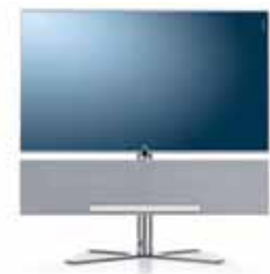
Floor Stand I SP + Sound Projector

Aufstellung: Alu Gebürstet 46": B 113,3/H 119,5/TP 6,0/FP 56,0 40": B 100,0/H 112,0/TP 6,0/FP 50,0 32": B 80,0/H 103,1/TP 6,1/FP 50,0