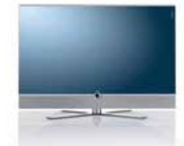
Table Stand I Sound + Stereospeaker Aufstellung: Chromauflage 46": B 113,3/H 82,7/TP 6,0/TG 35,1 40": B 100,0/H 75,1/TP 6,0/TG 35,1 32": B 80,0/H 65,0/TP 6,1/TG 31,4

Table Stand Aufstellung: Chromauflage 55": B 132,6/H 83,8/TP 6,0/TG 39,2 46": B 113,3/H 72,3/TP 6,0/TG 35,1 40": B 100,0/H 64,8/TP 6,0/TG 35,1